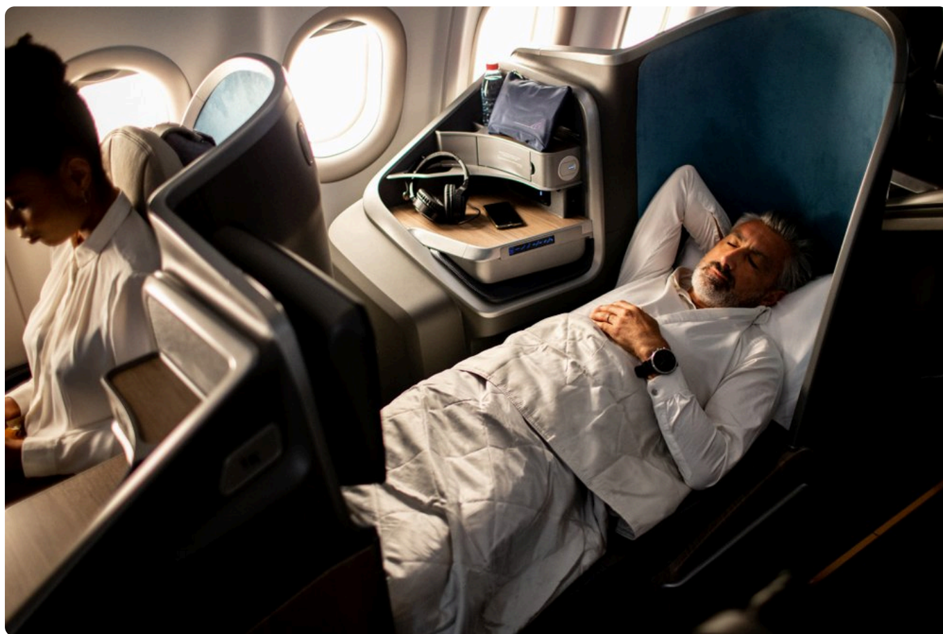
L'A330 Neo offre plus de sièges en business et en premium.